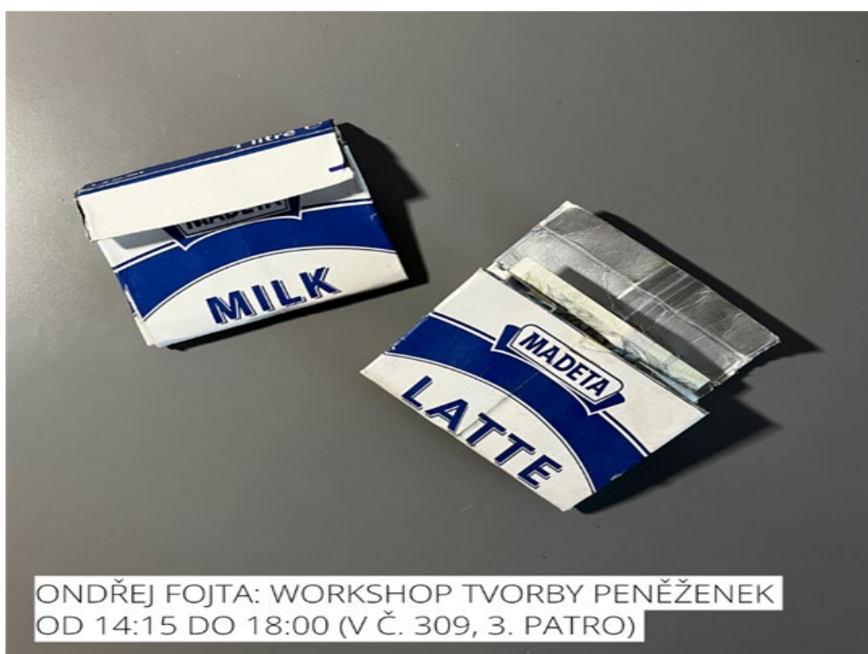
ONDŘEJ FOJTA: WORKSHOP TVORBY PENĚŽENEK OD 14:15 DO 18:00 (V Č. 309, 3. PATRO)