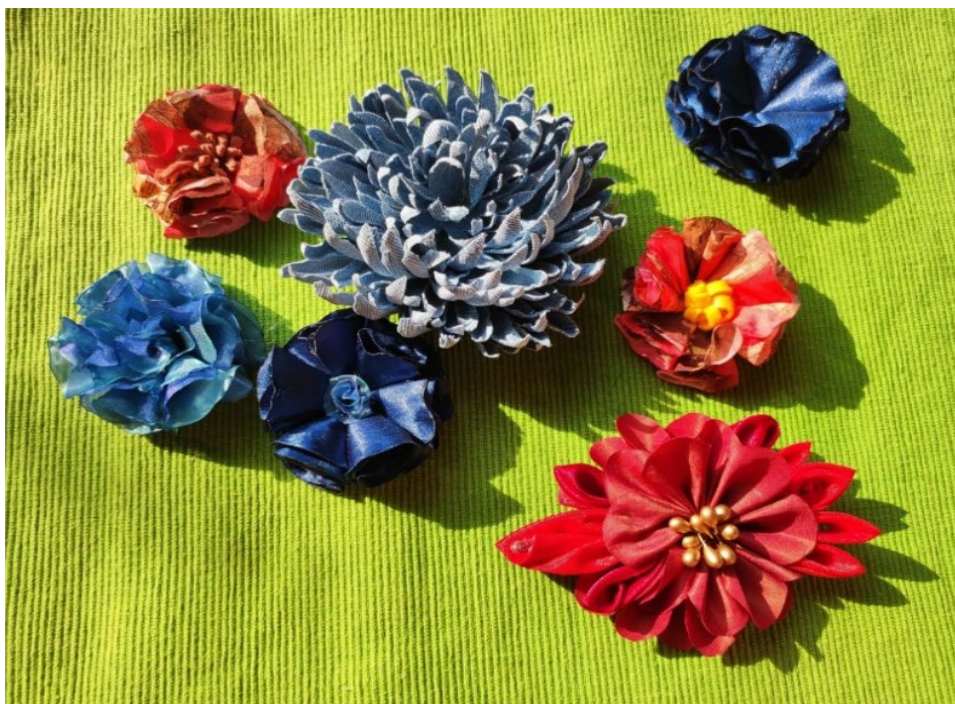
ALENA KOBYLKOVÁ: KVĚTINOVÉ BROŽE (V Č. 301, 3. PATRO) CHRYZANTÉMA Z RECYKLOVANÝCH DŽÍNŮ 12:30 - 14:00 RŮŽE DIOR - RŮŽE SKLÁDANÁ ZE ZBYTKŮ MATERIÁLŮ PO ŠITÍ 14:30 - 15:30 BROŽ ZE ZBYTKŮ ATLASOVÉ STUHY - TECHNIKA OŽEHOVÁNÍ 16:00 - 17:30